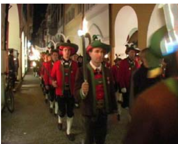
"L'ultimo saggio" di Rolf Mandolesi

Il programma comprendeva corti italiani come "IL NATURALISTA" di G.Barbera, G.Lo Presti, F.Parodi, M. Tozzi, "TRASPARENZE" di Giorgio Sabbatini "TRASLOCO" di Rossana Molinatti e "L'ULTIMO SAGGIO" di Rolf Mandolesi, spaziando poi sul giapponese "CLACSON" di Takehito Kuroha, il tedesco "STILLE POST" di Oliver Rauch, lo spagnolo "A XINECOLOGA" di Alfonso Camarero, l'argentino "LAPSUS"