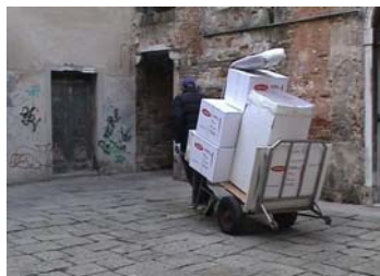
Dal film "Trasloco" di Rossana Molinatti

Venerdì 9 aprile ha avuto luogo la tradizionale serata di proiezione dedicata alle più rappresentative opere che hanno partecipato alla Mostra Internazionale di Montecatini. Una buona presenza di pubblico (i soci del cineclub Fedic "Certosa" di Casteggio e altri invitati) hanno gremito la saletta di proiezioni situata nel prestigioso palazzo progettato e costruito dagli stessi architetti a cui si deve la Certosa di Pavia.